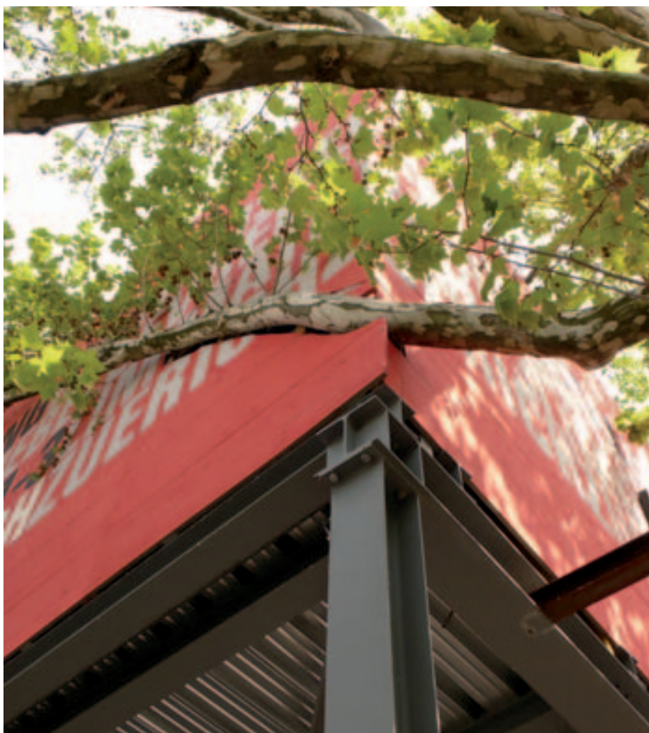
Les quartiers durables vont dans le sens d'une meilleure cohabitation entre les ambitions humaines et la préservation de la nature en milieu urbain.

Conçus en fonction des principes du développement durable et conciliant préservation de l'environnement, efficacité économique et équité sociale, les quartiers durables peuvent être les vecteurs d'un développement territorial durable. Pourtant, s'ils ont le potentiel de faire émerger cette nouvelle façon d'envisager la ville en se posant en véritables exemples des «mutations urbaines amorcées pour négocier le virage de la durabilité» 4 , ils se résument aussi parfois à une étiquette galvaudée