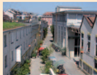
Le centre du quartier se situe dans les anciens bâtiments de l'industrie Sulzer-Burkhardt.

Pour plus d'informations : www.gundeldingerfeld.ch